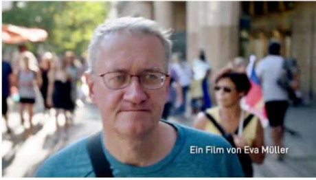
Ein Film von Eva Müller